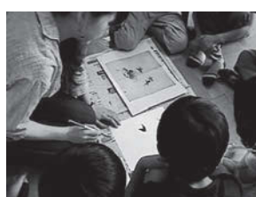
図6 実演指導の様子

筆画指導においては粉本を使用して、3年生児童がこれを臨写する活動を設定することとした。実際に使用した粉本は、本学の前身である京都府画学校の東宗教員を務めた望月玉泉（1834-1913）が日本画指導のために描いたと考えられる5種である（図1～5。いずれも本学・教職課程研究室所蔵）。指導にあたっては、実物から電子スキャナーによって作成したデジタルデータをもとに、A3用紙にカラー印刷したものを児童全員に配布して使用に供した。