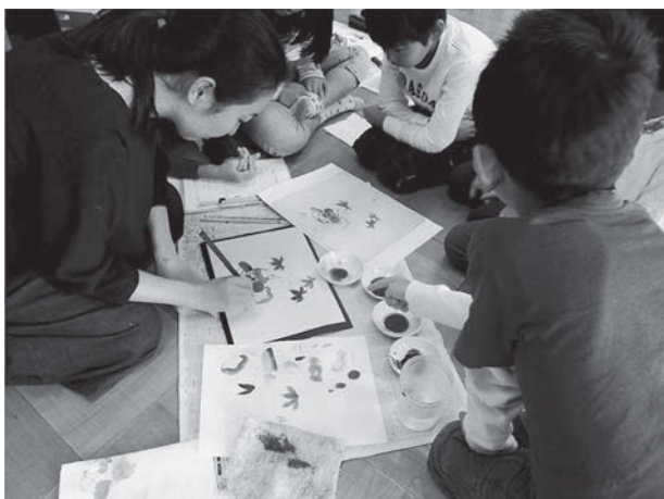
図7 大学院生による実演指導

「普段の制作では三次元の対象物を二次元的な線に置き換え、そのものの捉え方を探りながら絵を描い