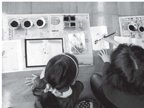
図9 大学院生から児童への個別指導