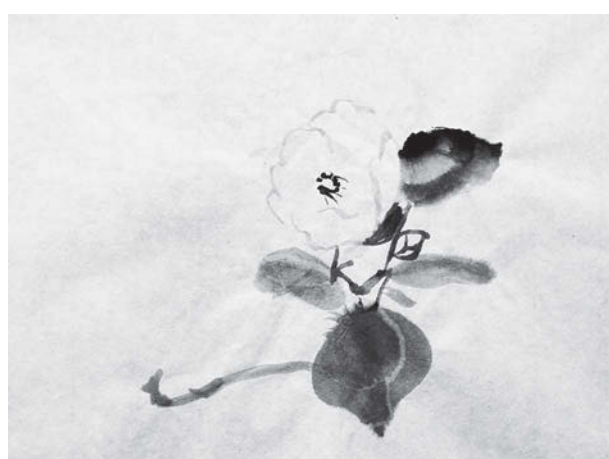
図10 3年生児童による臨写作品