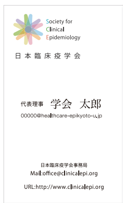
シンボルマークは、異なる立場の6人を回転させて重ねたデザイン