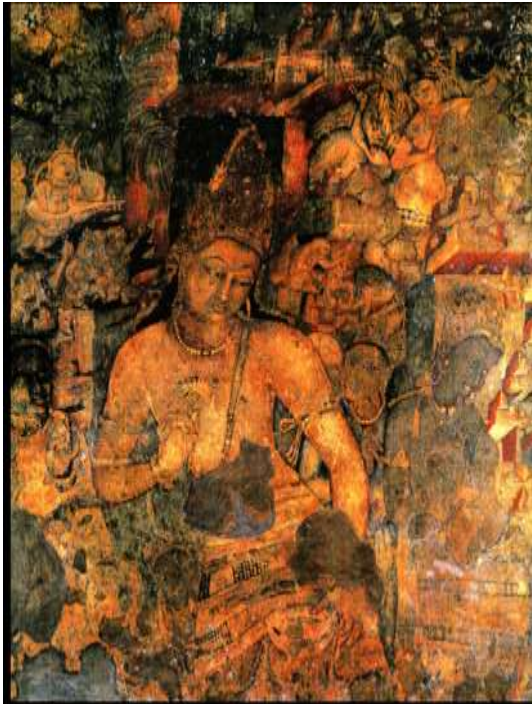
図 2-12 〈守門神〉 アジャンター第1窟後廊後壁 6世紀