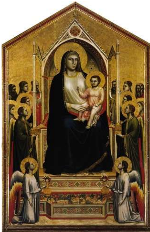
図 1-5 ジョット・ディ・ボンドーネ 〈荘厳の聖母〉1310年 表 キリスト教美術