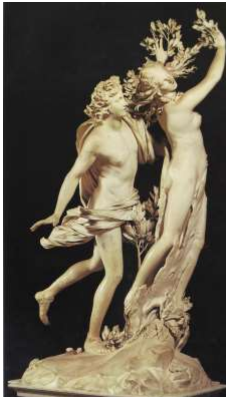
図 2-11 ジャンロレンツォ・ベルニーニ 〈アポロとダフネ〉 1622-23年