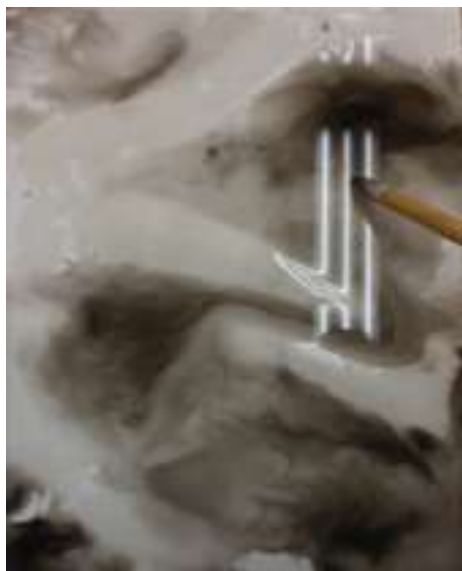
墨による垂らし込みの制作