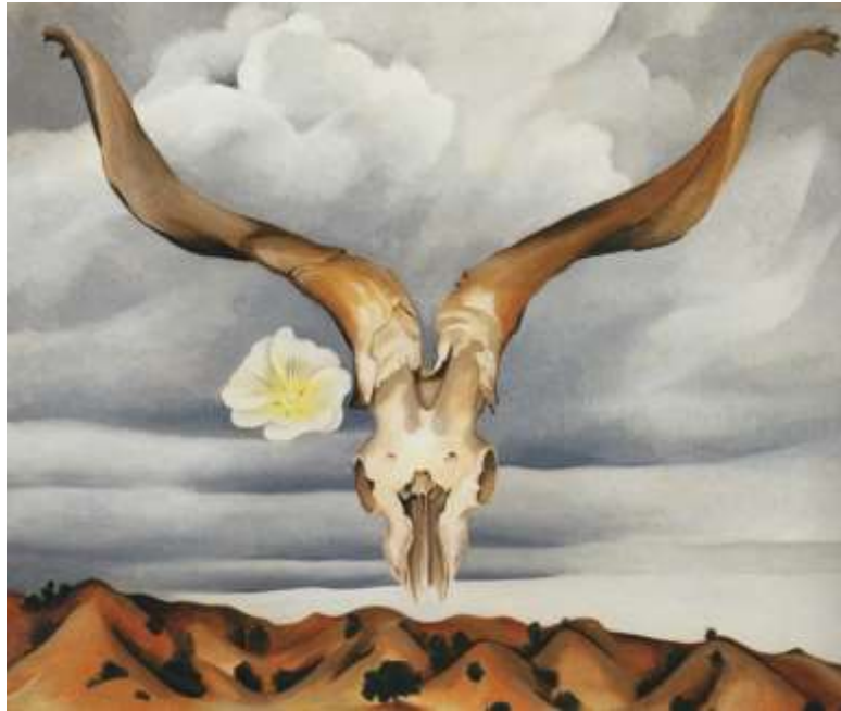
図 1-24 ジョージア・オキーフ 〈雄羊の頭とタチアオイ、丘〉 1935 年