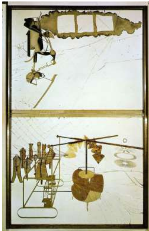
図 1-11 マルセル・デュシャン 〈花嫁は彼女の独身者たちによって裸にされて、さえも〉 1915-1923 年