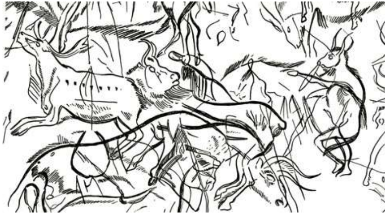
図 1-2 〈笛を吹く呪術師〉レ・トロア・フレール洞窟 (聖所) 後期旧石器時代 (ブルーユ神父の明細画の一部)