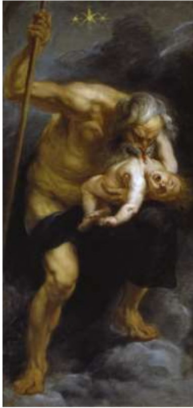
図 1-8 ピテール・パウル・ルーベンス 〈我が子を食らうサトゥルヌス〉 1636-1637 年