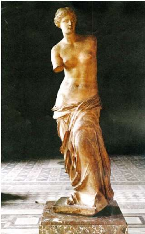
図 1-3 〈ミロのヴィーナス〉 紀元前 100 年頃