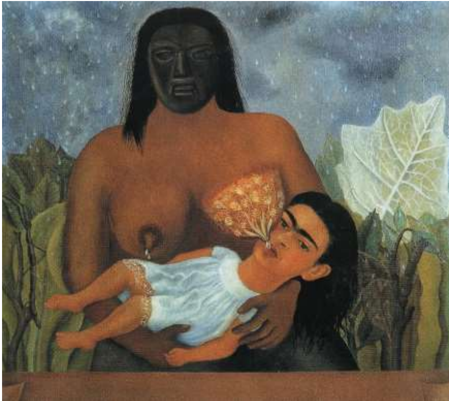
図 1-17 フリーダ・カーロ 〈乳母と私〉 1937年