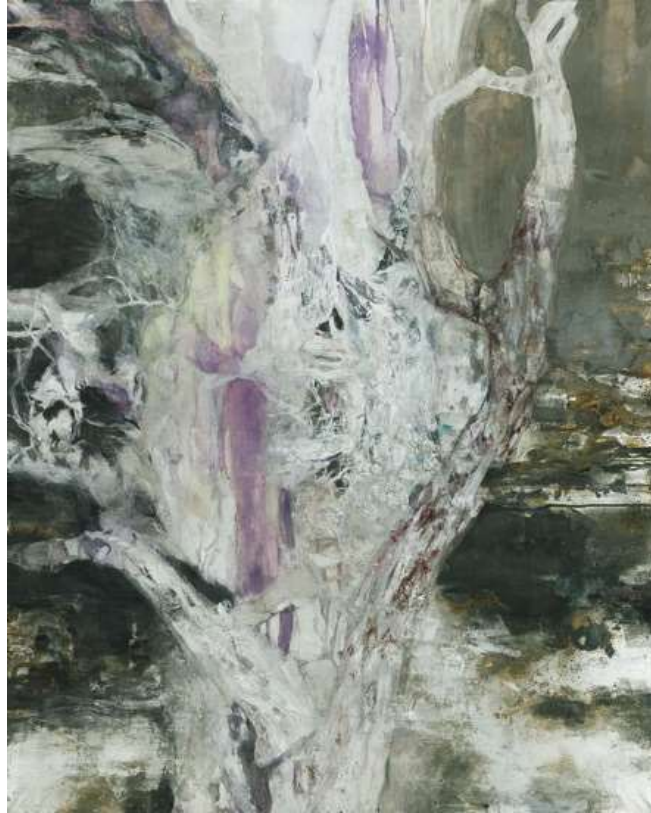
図 2-3 〈白の輪舞〉 2013 年