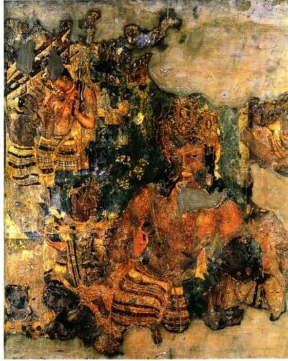
図 2-13 〈守門神〉 アジャンター第1窟後廊後壁 6世紀