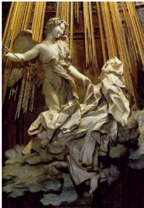
図 2-9 ジャンロレンツォ・ベルニーニ 〈聖テレサの法悦〉 1647 - 1652年