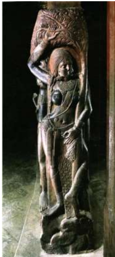
図 2-2 〈ヤクシー立像〉紀元前 1 世紀 インド マディヤ・プラデーシュ州 パールフット出土