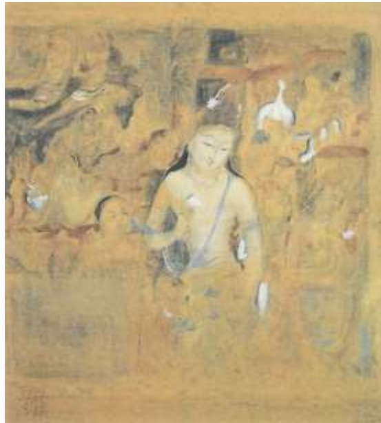
図 2-14 村上華岳 〈アジャンター壁画模写〉 1916年