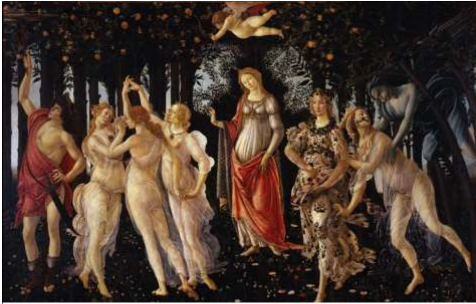
図 2-1 サンドロ・ボッティチェリ 〈春〉 1482 年