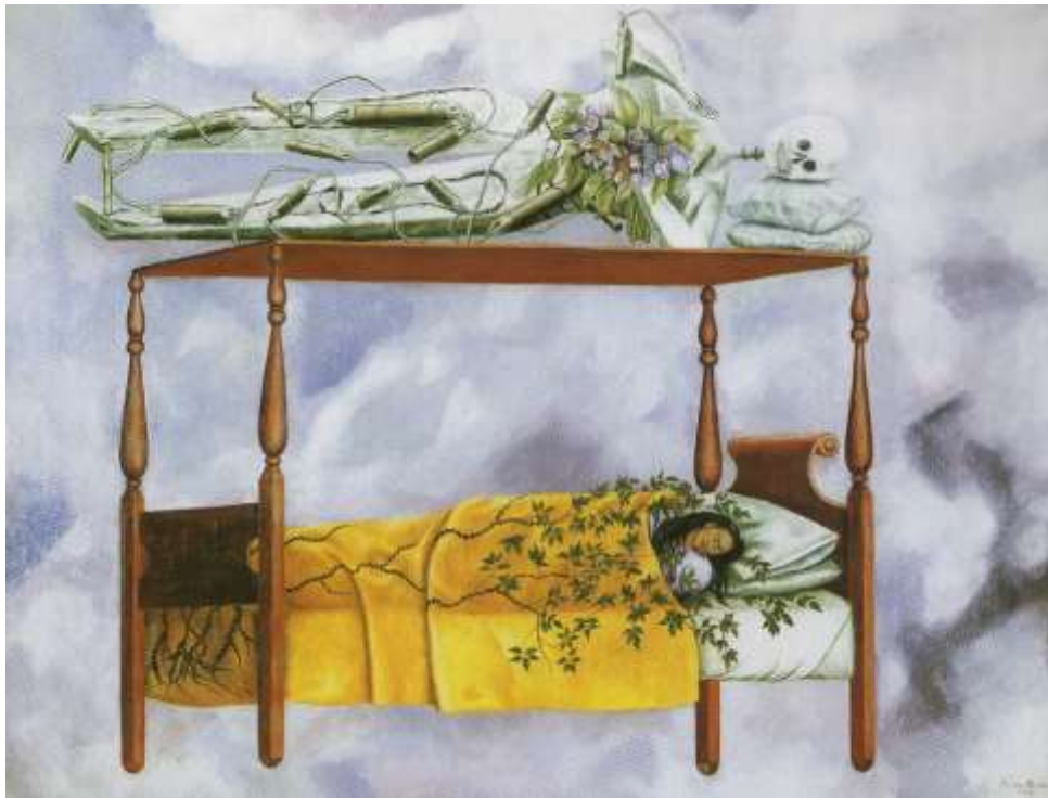
図 1-18 フリーダ・カーロ 〈夢〉 1940年