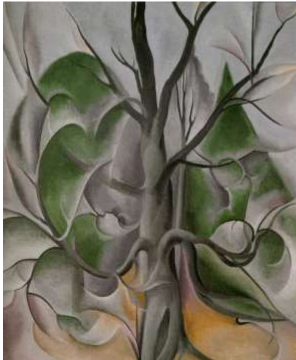
図 1-23 ジョージア・オキーフ 〈灰色の木、ジョージ湖〉 1925年