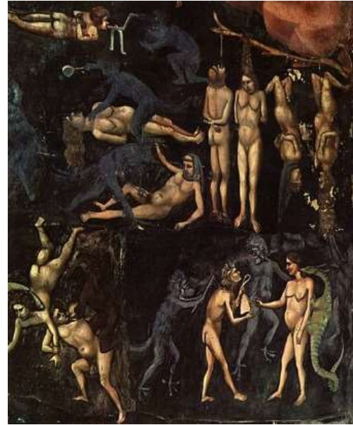
図 1-6 ジョット・ディ・ボンドーネ 〈最後の審判 一部〉1306年 裏 エロティックイズム (負のエロスのイメージ)