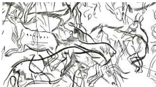
図 2-5 レ・トロワフレール

恍惚状態は穴の先へとつながる架け橋なのだ。この穴の先に私は夢を見、連続性への憧れに浸っている。