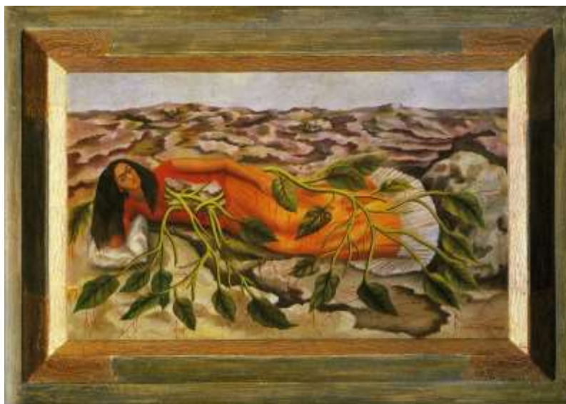
図 1-21 フリーダ・カーロ 〈根〉 1943 年

まるで古代社会の呪術師のような存在であった、というのである。「創造の魂」の一語はフリーダの描く血まみれの心臓のようになまなましく、永遠の生命を意味するエロスの根源を思わせる（図 1-19 〈サボテンの実〉） 88 （図 1-20 〈生命万歳〉） 89 。