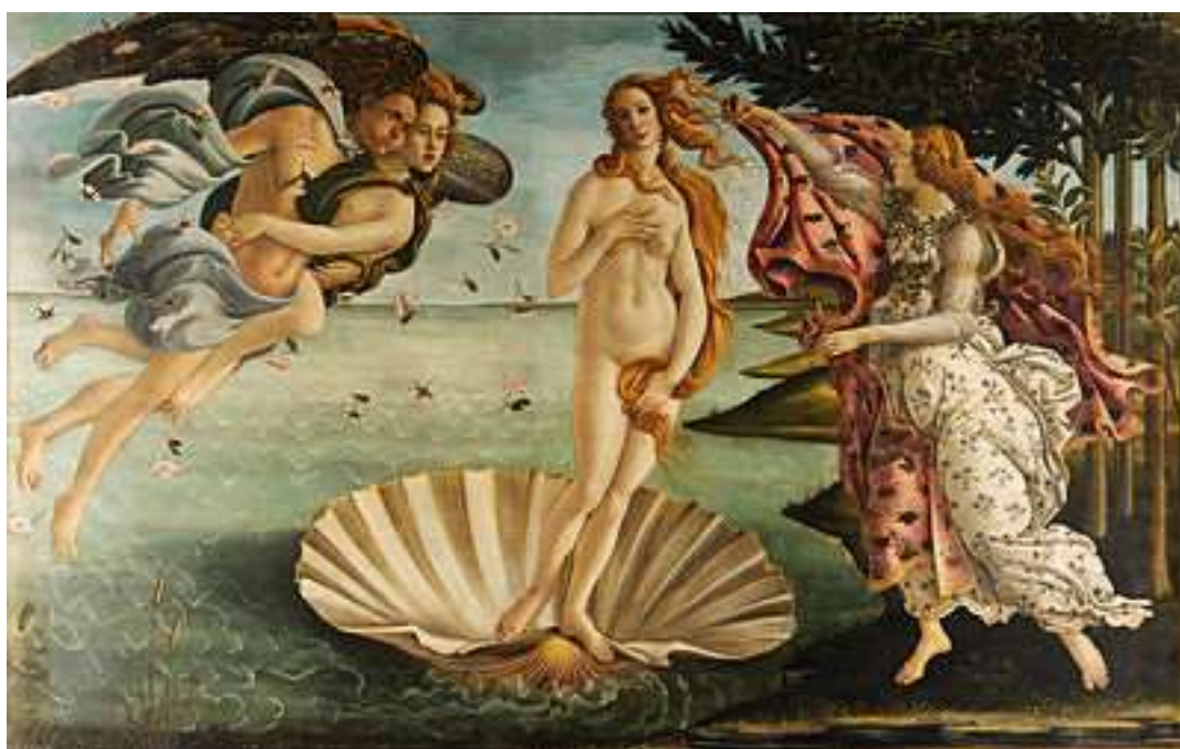
図 1-7 サンドロ・ヴェロッキオ〈ヴィーナスの誕生〉1485年

「ヴィーナスを低俗的なものから天上的なものへ高めることがヨーロッパ芸術の常に立ち還る目標のひとつとなって来た」 26 という。エロスは太古より、肉体的欲望を正当化するものであった。