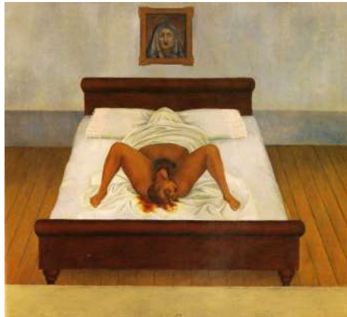
図 1-16 フリーダ・カーロ 〈私の誕生〉 1932 年