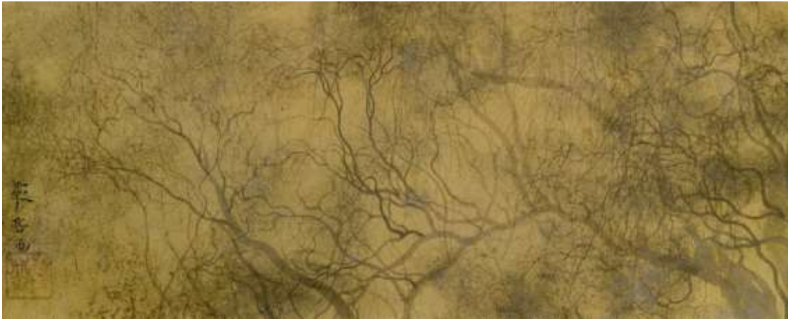
図 2-16 村上華岳〈秋柳図〉1938年