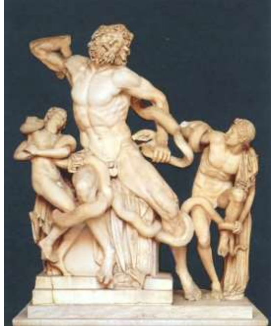
図 1-4 〈ラオコーン〉 紀元前 40 年—紀元前 20 年頃

私は考える。『饗宴』はエロスの隠された側面を暗示してくれた。エロス生きる意味を満たしてくれると同時に、その芸術表現は今日に至るまでつたわる永遠性すなわち不死を約束するものだろう、と。