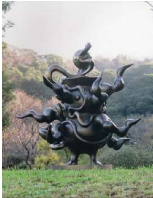
図 1-13 岡本太郎〈縄文人〉1981年