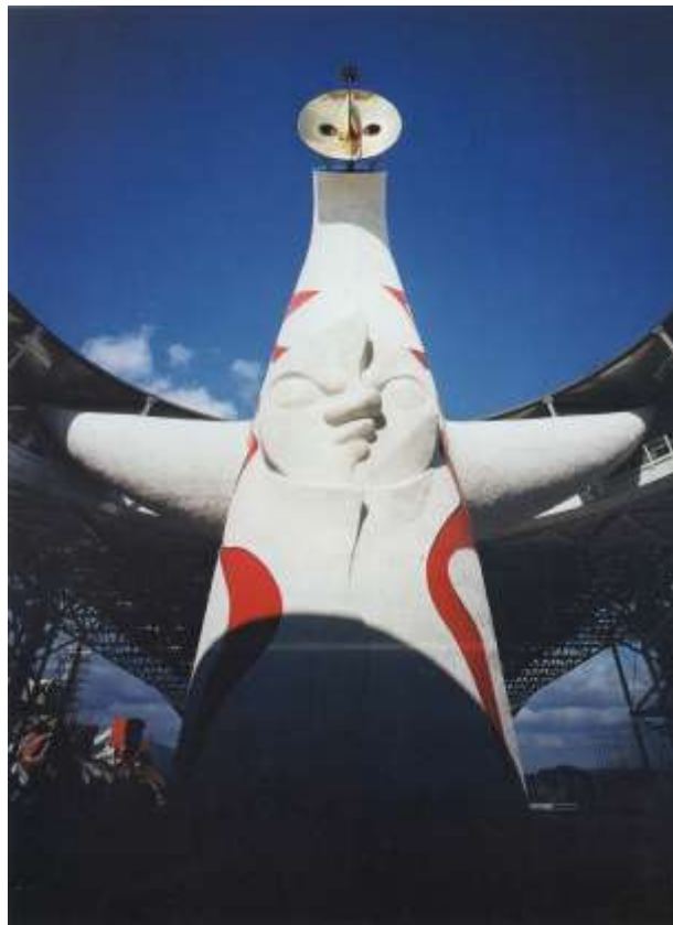
図 1-14 岡本太郎〈太陽の塔〉1970年