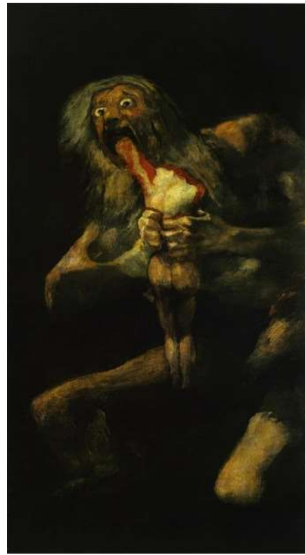
図 1-9 フランシスコ・デ・ゴヤ 〈我が子を食らうサトゥルヌス〉 1819-1823 年