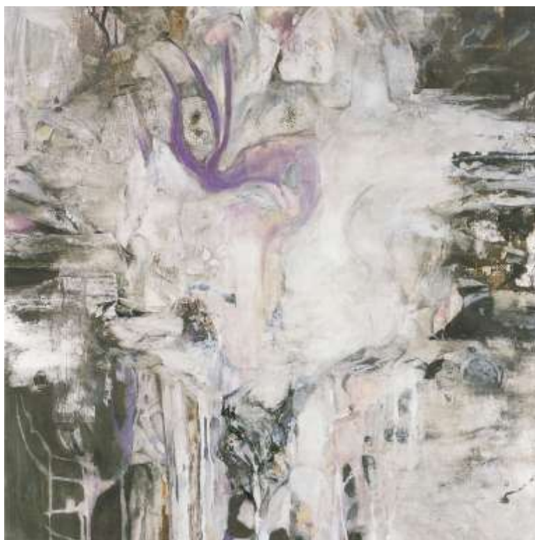
図 3-3 〈輪舞〉2014年

視られなければ作品ではない。視せることの難しさに、私の意識はいつも直面するのである。