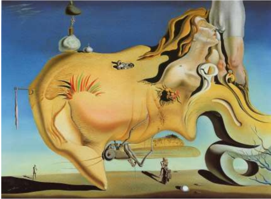
図 1-10 サルバドール・ダリ 〈大自詠者〉 1929 年