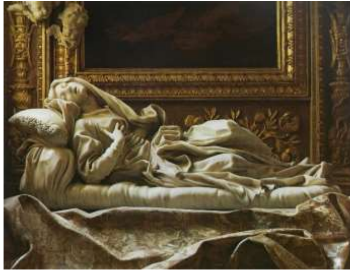
図 2-10 ジャンロレンツォ・ベルニーニ 〈福女ルドヴィカ・アルベルトーニ〉 1671-74年