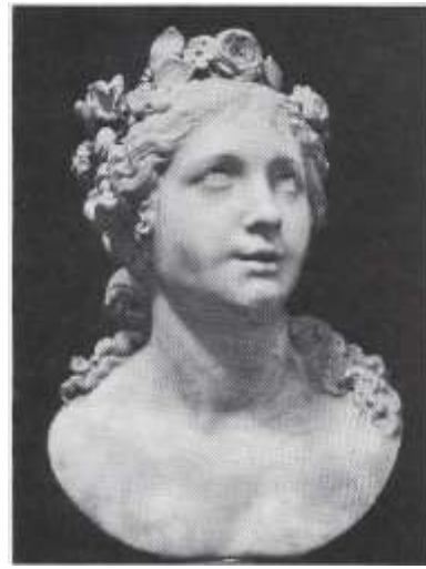
図 2-8 ジャンロレンツォ・ベルニーニ 〈祝福される魂〉 1916年顔の表情の習作