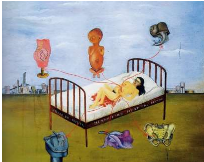
図 1-15 フリーダ・カーロ 〈ヘンリーフォード病院〉 1932 年

フリーダの作品には熱帯の強烈な陽光が溢れ、そこに自傷的に歪んだグロテスクな肢体が描かれるのである（1-15 〈ヘンリーフォード病院〉）（1-16 〈私の誕生〉） 74 。