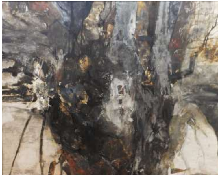
図 2-4 〈黒の輪舞〉 2013 年