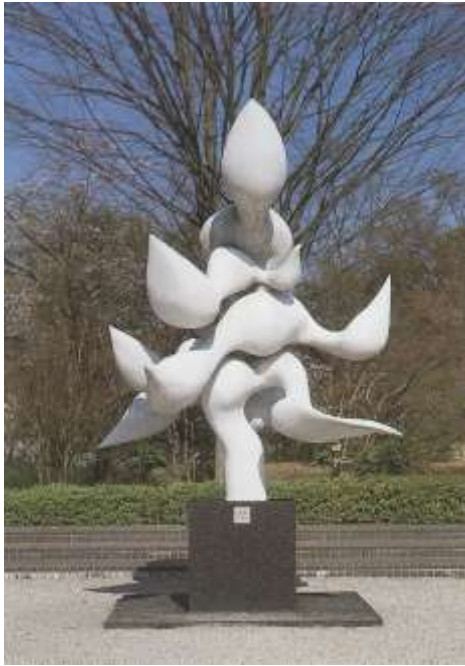
図 1-12 岡本太郎〈樹人〉1971年