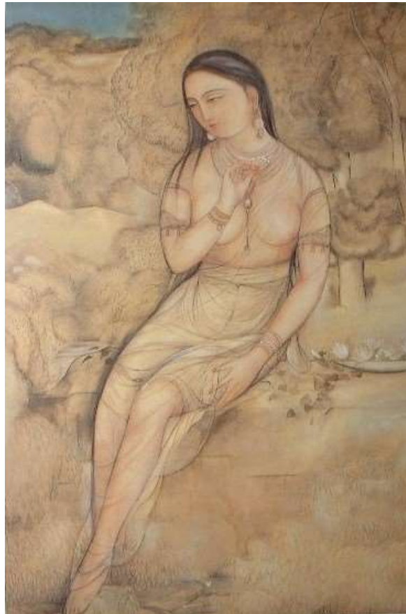
図 2-15 村上華岳〈裸婦図〉1920年

官能的な裸婦ではなく華岳は「永遠の女性」の中に万物を超越したものを描こうとした。