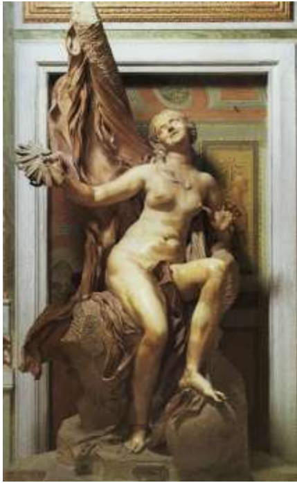
図 2-7 ジャンロレンツォ・ベルニーニ 〈真実〉 1646-52年