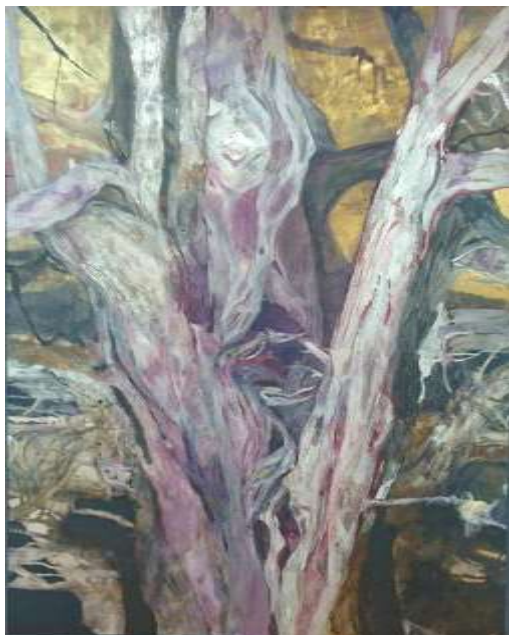
本画 A 〈恩寵の扉〉 2015 年