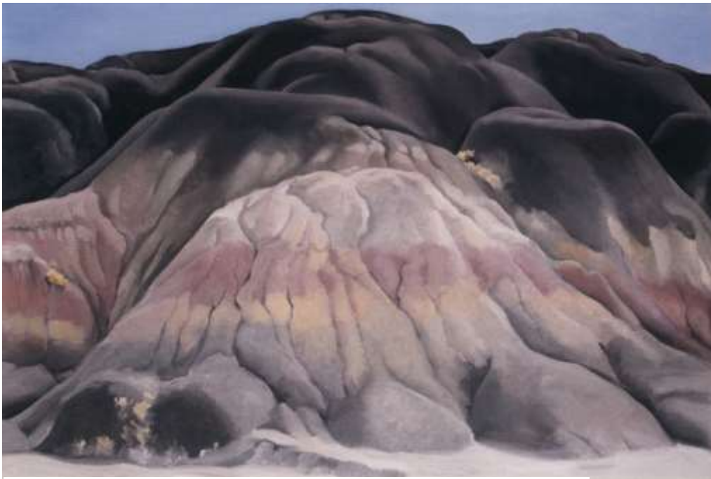
図 1-25 ジョージア・オキーフ 〈灰色の丘〉 1941 年