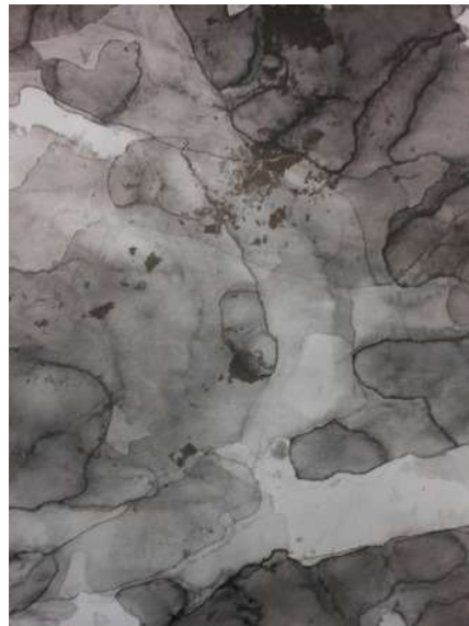
墨の垂らし込みによるマチエール

その頃は、樹の内側、樹肉（樹皮の内部の部分を取りあえずこのように表記する）の部分表現した淡紅色で下地を表現していたが、写生を重ね、作品数が増えるにつれ、樹肉の部分よりもっと奥、さらに深い場所には何かがあるのではないかと気づいた。人間で譬えるならば皮膚、筋肉、臓器、それよりもっと奥の世界だ……。秘部というべきかもしれない。まさに樹の「靈性」の宿る場所だ。その時、以前行った垂らし込みを思い出した。