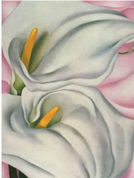
図 1-22 ジョージア・オキーフ 〈ピンクの上の2つのカラ・リリー〉 1928年