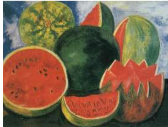
図 1-20 フリーダ・カーロ 〈生命万歳〉 1954年

アンドレ・ブルトンがメキシコについて「このうえなくシュルレアな国」 75 と喝破した。また「私はメキシコの地形や植生、人種混交が生み出すダイナミズム、その高い抱負の中に、シュルレアなものを見いだす」 76 と記している。