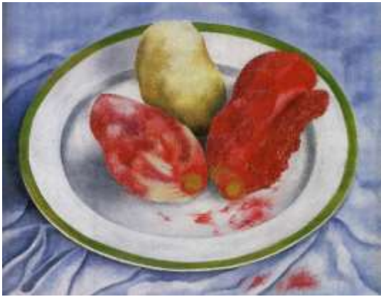
図 1-19 フリーダ・カーロ 〈サボテンの実〉 1937年