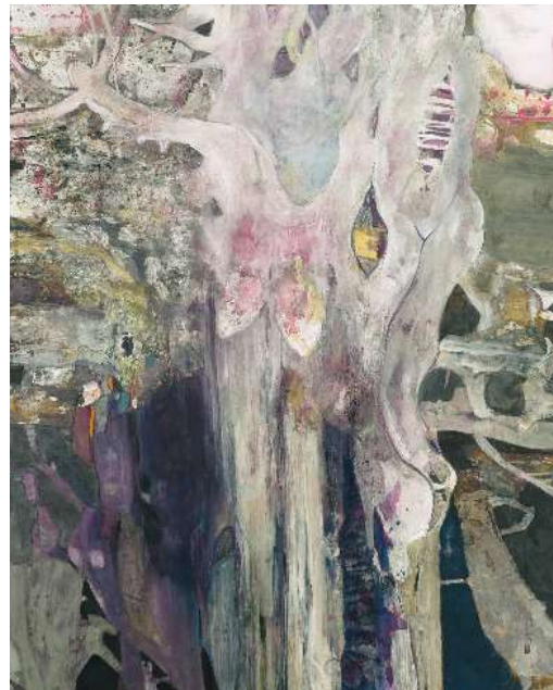
本画 B 〈樹に宿る〉 2015 年