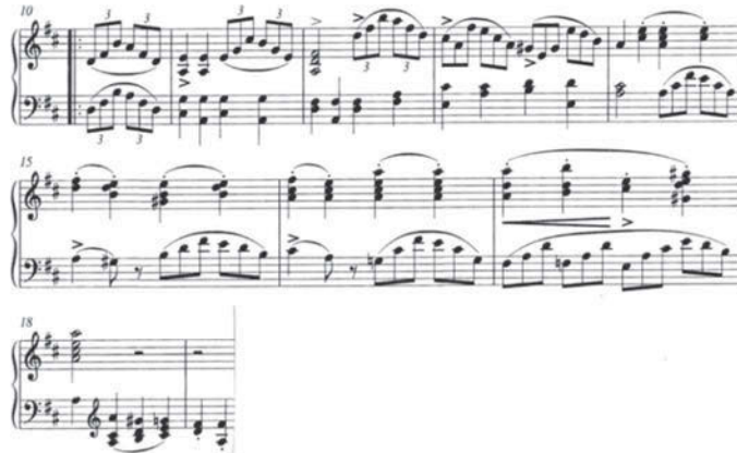
譜例 11 \boxed{A} a_1 (第 10～18 小節)

第 2 小節から第 10 小節の右手パートは、付点リズムが基調となっているが、第 10 小節から第 18 小節では、第 8、9 小節で導入された 3 連符を引き継ぐように、3 連符が基調となって旋律が展開されてゆく。このように、旋律の表層こそ異なるものの、アウフタクト 2 拍分と 3 小節半で構成される単位が 2 回繰り返されている点では共通している。