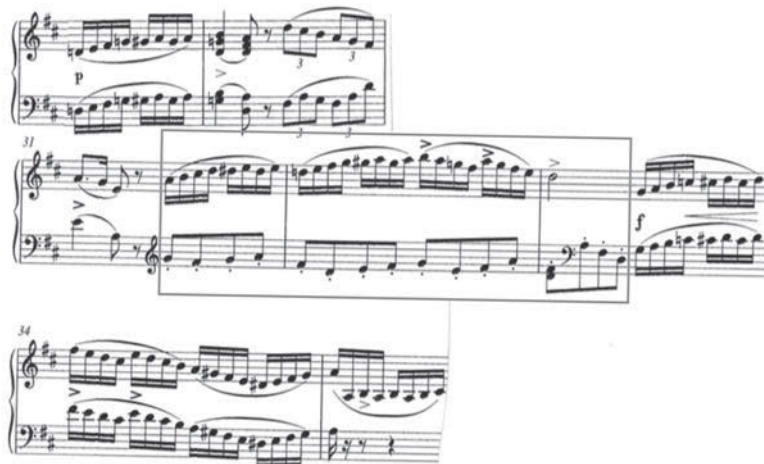
譜例 12 \boxed{B} b_1 (第 29～35 小節)

次に、 \boxed{A} a_1 の第 14 小節第 3 拍から第 18 小節第 2 拍までの左手旋律と、 \boxed{B} b_1 の第 29 小節から第 33 小節第 2 拍までの右手旋律を比較する（譜例 11、12 参照）。