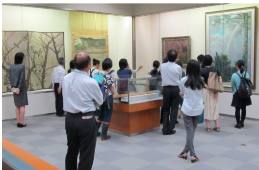
第2期 四季を描くー近代花鳥風月 ギャラリートーク