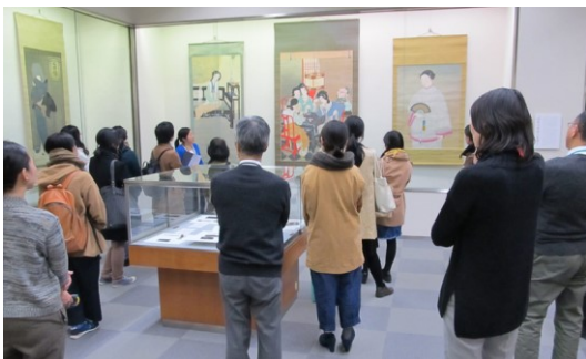
第5期 美人画ー粧いと風俗 ギャラリートーク