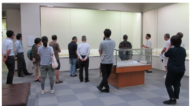
第3期 妖怪三昧ー異形のものゝ棲むところ ギャラリートーク