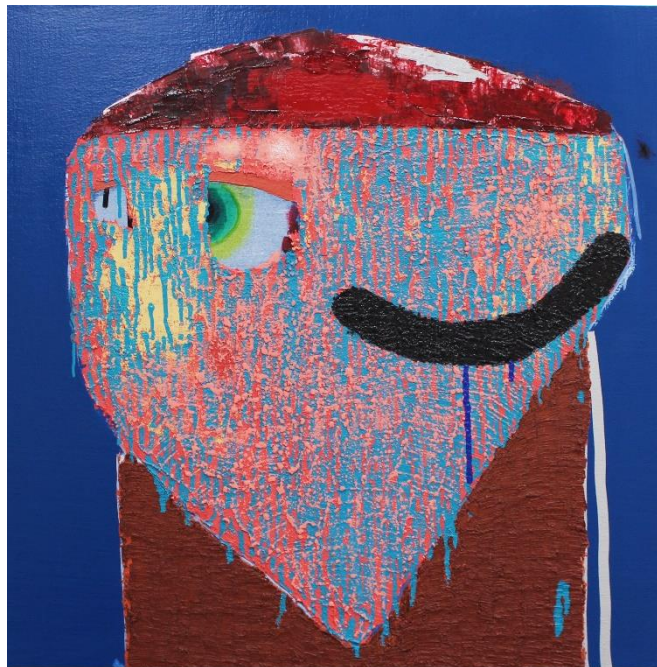
図 13 西村有未《人魚の母親》2018年、パネル・麻布に油彩、650×650mm