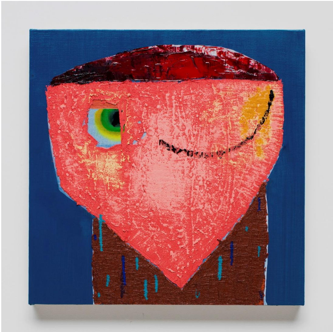
図4 西村有未《小川未明の「赤いそうろくと人魚」(p.17)の人魚2》、2018年、パネル・麻布に油彩、535×535mm