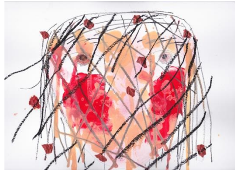
図7 西村有未《人魚の母親2》2018年、紙にオイルパステル・アクリル・チャコールペンシル・鉛筆・コラージュ、240×332mm