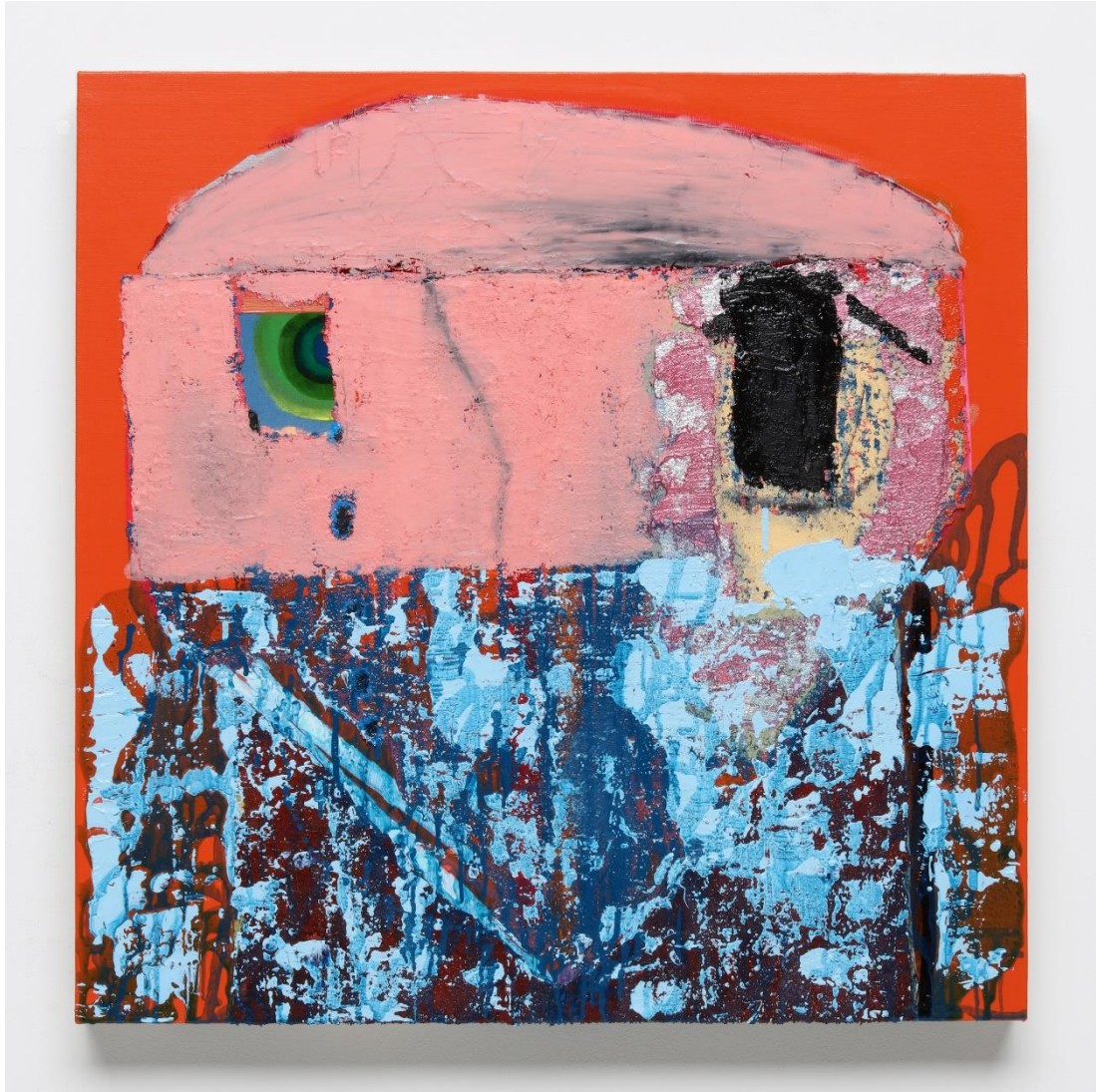
図5 西村有未「小川未明の『赤いそうろくと人魚』」(p.19)の人魚の実母3」、 2018年、パネル・麻布に油彩、655×655mm