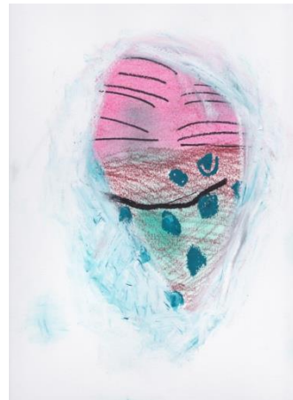
図9 西村有未《人魚の母親4》2018年、紙にオイルパステル・パステル・チャコールペンシル、332×240mm