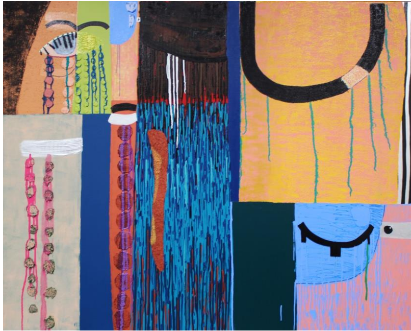
図 15 西村有未《泣くの練習(6つの涙)》2017年、パネル・麻布に油彩、 1620×1300mm