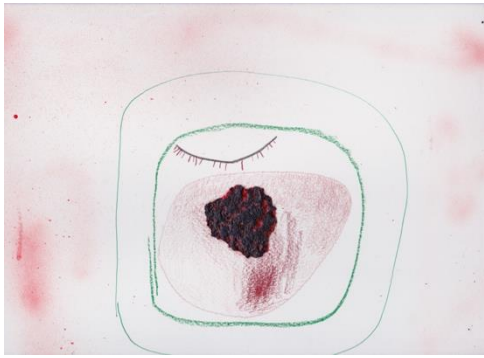
図6 西村有未《人魚の母親1》2018年、紙にオイルパステル・色鉛筆・チャコールペンシル、240×332mm