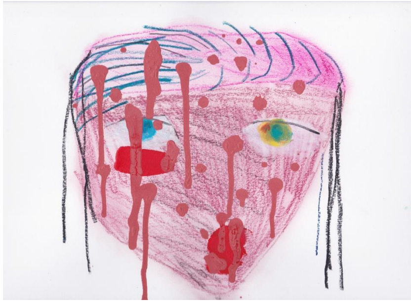
図 12 西村有未《人魚の母親7》2018年、紙にオイルパステル・色鉛筆・アクリル・チャコールペンシル、332×240mm