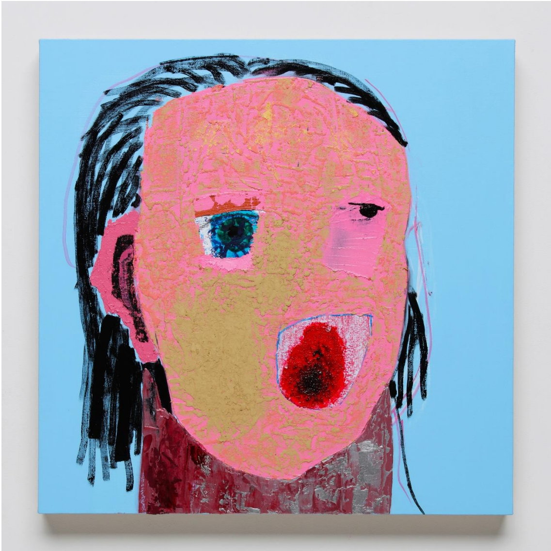
図2 西村有未「小川未明の「赤いそうろくと人魚」(p.17)の人魚1」、2018年、パネル・麻布に油彩、655×655mm