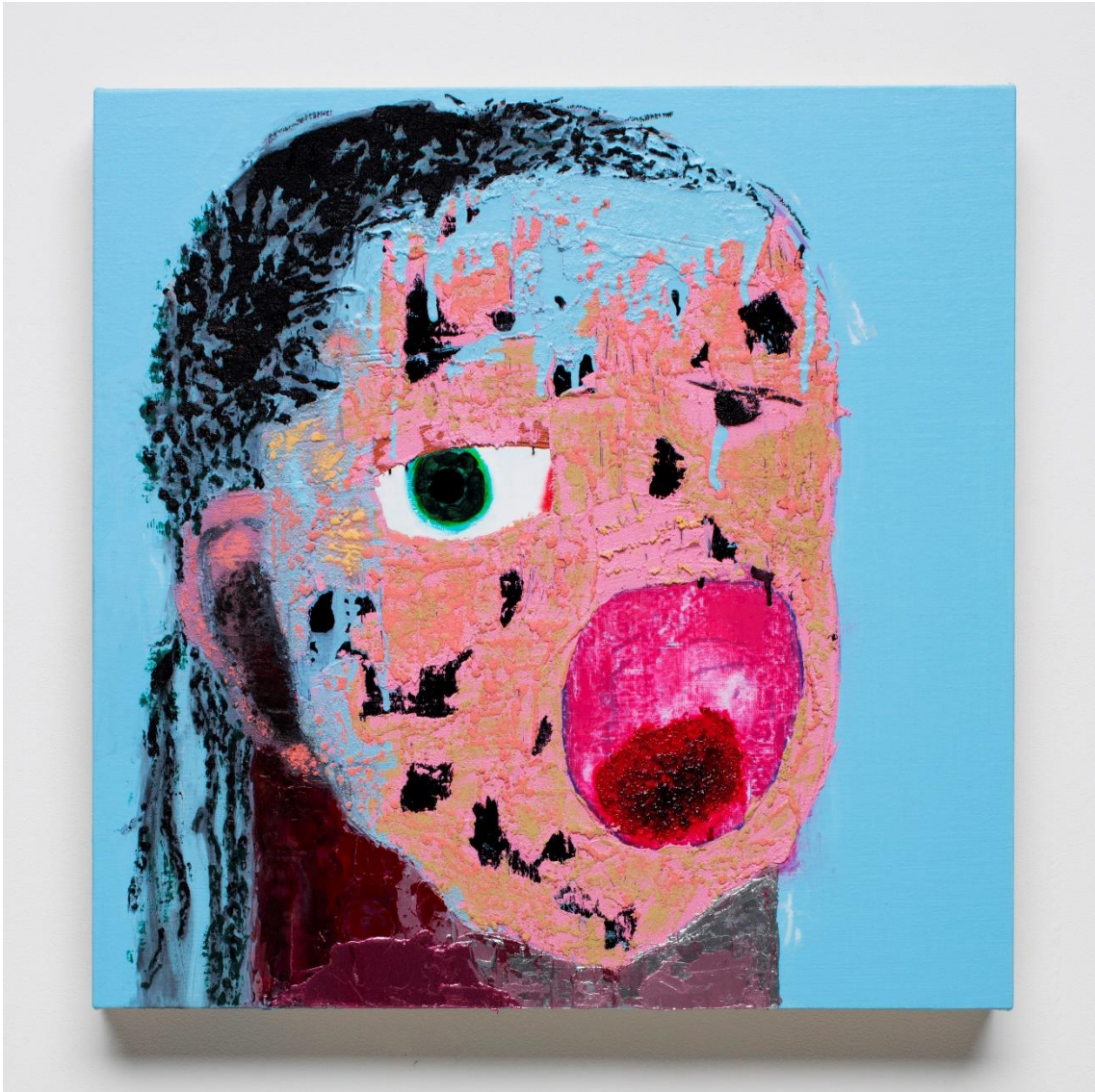
図3 西村有未«小川未明の「赤いそうろくと人魚」(p.17)の人魚2»、2018年、パネル・麻布に油彩、535×535mm