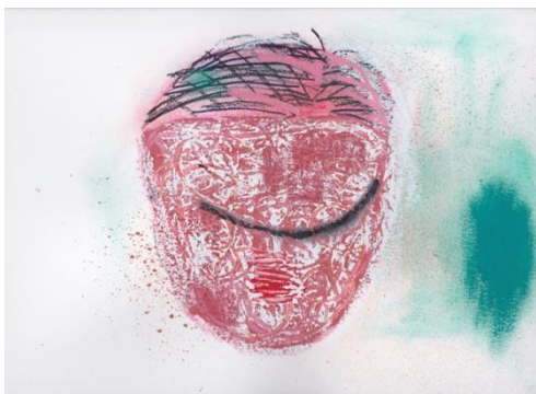
図10 西村有未《人魚の母親5》2018年、紙にオイルパステル・パステル・アクリル・チャコールペンシル、240×332mm