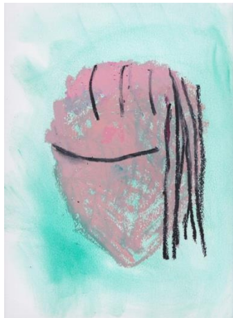
図8 西村有未《人魚の母親3》2018年、紙にオイルパステル・色鉛筆・チャコールペンシル、332×240mm