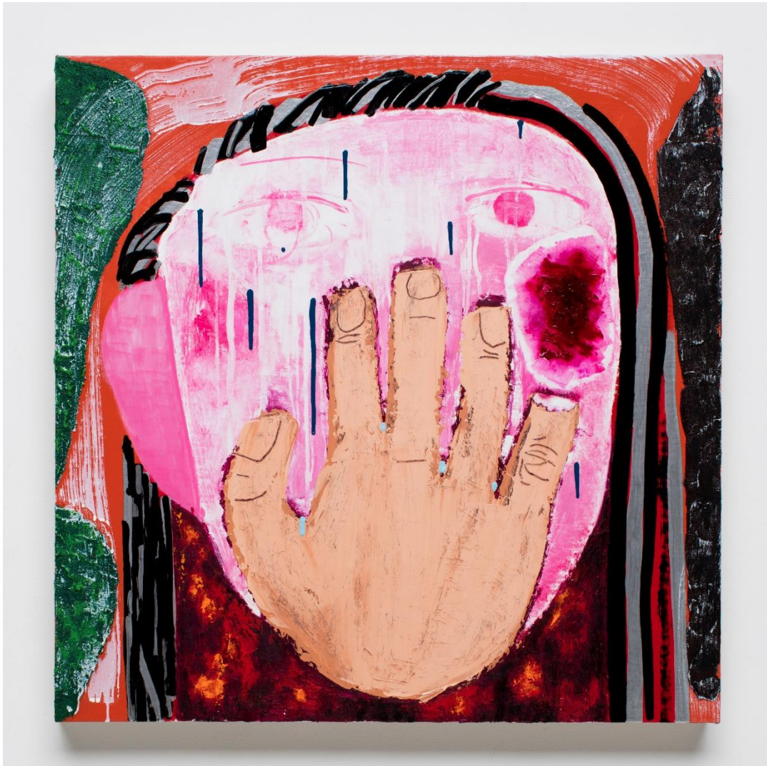
図 14 西村有未《「グリム童話(上)」(p.200)の7羽のカラスの兄弟の妹2》2018年、パネル・麻布に油彩、650×650mm