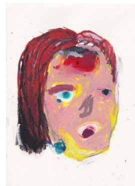
図11 西村有未《人魚の母親6》2018年、紙にオイルパステル・色鉛筆・チャコールペンシル、水彩絵具、195×265mm