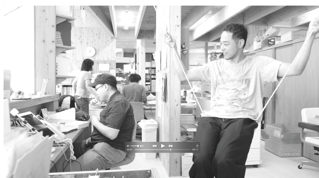
図2,3,4,5 contact Gonzo ワークショップ