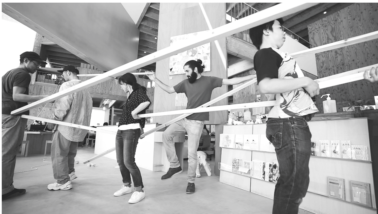
図-1 GoodJob!センター香芝でのワークショップ風景より

非人間的なものには、頭を下げた官僚・警官または裁判官・被告のままであるよりも、甲虫になること、犬になること、猿になること「ひっくり返りながら大急ぎで逃げ出す」といった下=人間的なものが対応する。