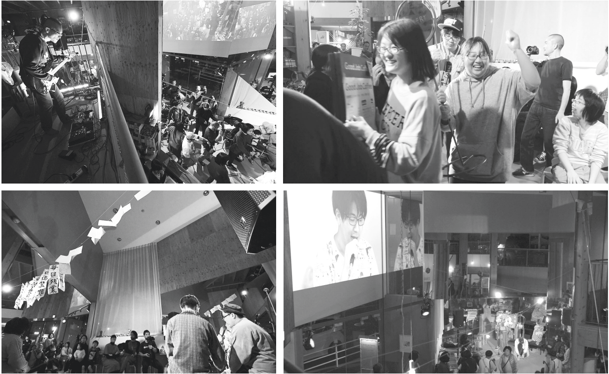
図-10, 11, 12, 13 パフォーマンスイベント

出演：contact Gonzo × Shing02、Good Job! センター 香芝のメンバーとスタッフ