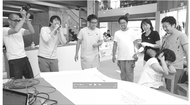
図-6,7,8,9 Shig02 ワークショップ

は、ケアのフィールドへ contact Gonzo が越境すると同時に、GJ！センターのメンバー達が Gonzo のフィールドへと越境するという相互的な方法で場が形成されていった事だ。それは「単純労働、時間管理、低賃金」がワンセットになった働きかたとは別の可能性や、仕事と遊びの境界の再考へと我々を導くことになった。