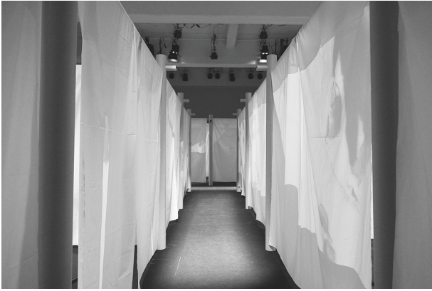
図-14 状況のアーキテクチャー展

「私にとって、理想的な上映とは、無声の映画が流れるいくつかのテレビ画面を備えたカフェのような場所です。音は左右にある、テレビ画面とは関係のない、小さなスピーカーから流れています。カフェの客は突如として、別々であったものが一つとなることを自然と理解します。そのような事態に到達するまで、これらか先、100年近くの戦いを必要とするかもしれません。それでも、希望を持ち続ける価値はあります。」 J・L・G