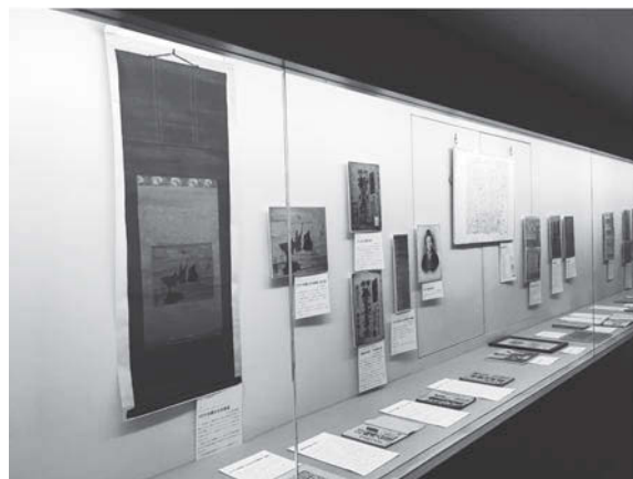
京都と人形浄瑠璃 展示風景